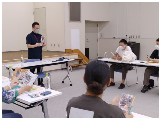
南相馬市社会福祉協議会の方からお話を聴く