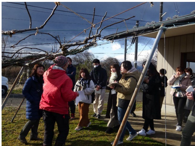
福島市の農園見学