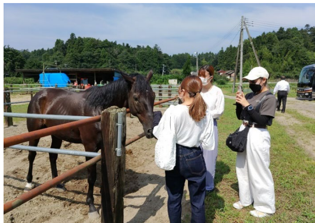
相馬野馬追に出場する馬の厩舎を見学